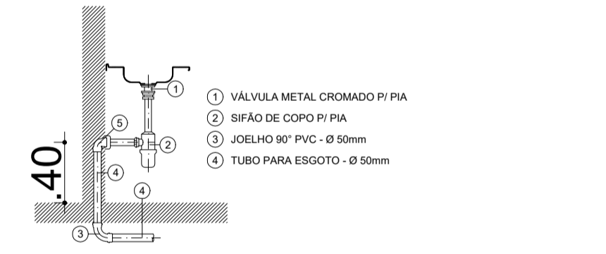
DETALHE - pia de cozinha ESC: 1/20